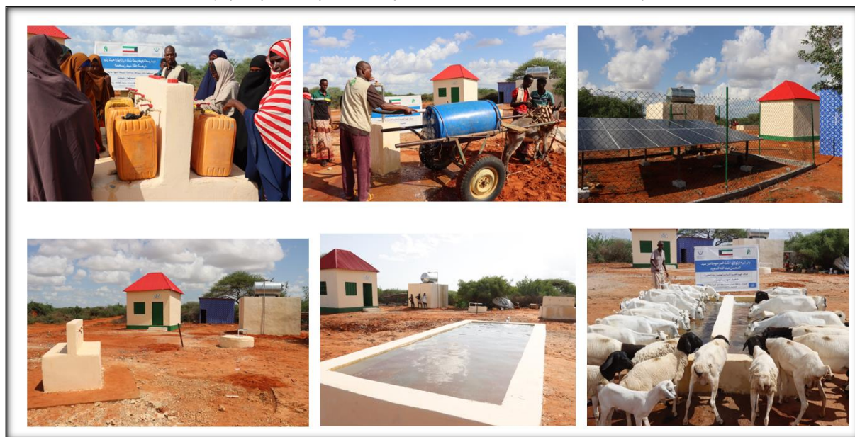
Shaxda 5: Ceelka oo shaqaynayo oo ay dadka iyo xoolaha ooman ka waraabayaan

Ceelka wuu shaqaynayaa: Waxaan xiriir la sameynay hey'adda Zamzam Foundation oo ah hay'ad khayri ah, nasiib wanaag waxay nagu caawisay sidii aan u heli lahayn solarka qorraxda ku shaqeeya iyo bambada biyaha soo saarta, taasoo noo sahlaysa inaan helno biyo nadiif ah oo joogto ah. Waxay sidoo kale noo dhiseen qol yar oo lagu xareeyo alaabta ceelka si aan uga hortagno inay wasakhoobaan ama ay lumaan. Intaa waxaa dheer, waxay noo dhiseen barkad biyaha lagu shubo si ay xoolaha uga cabbaan, dadkuna ay uga dhaansan karaan, taas oo kor u qaadaysa noloshooda iyo wax soo saarkooda xoolaha (fiiri shaxda 5). Ceelkani wuuu wax weyn ka beddelay nolosha dadka reer miyiga ah ee degaanka ku nool iyo dadka safarka ahba.